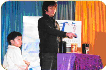
▲ 「有個秘密話你知」表演活動剪影。