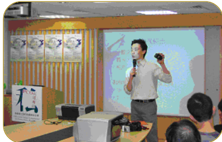
▲ 公署在香港舉辦了兩次工作坊，吸引了超過 200 名市民參加，學習個人資料私隱和攝影技巧。