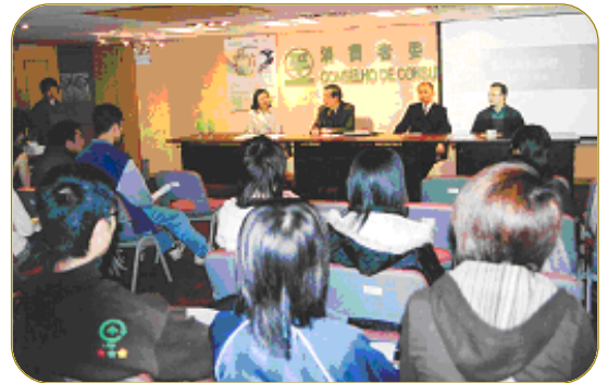
▲ 在澳門舉辦的工作坊，向攝影比賽參加者介紹消費權益、個人資料私隱及攝影技巧。