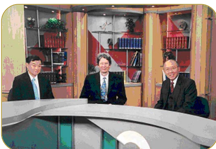
▲ 公署代表接受傳媒訪問解釋條例的規定。