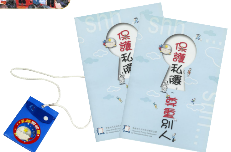
▲ 公署特地印製小冊子及紀念品送給所有參與此活動的學生。