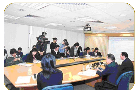
▲ 人力資源管理學會及公署在記者會上公佈調查結果。