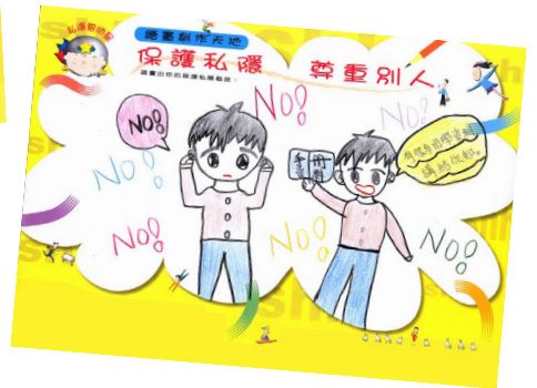
▲ 小學生以圖畫來表達他們對保障個人資料私隱的體會。