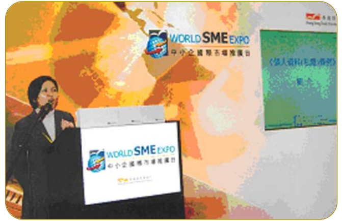
▲ 公署代表在「中小企國際市場推廣日」向在場人士簡介條例內容。