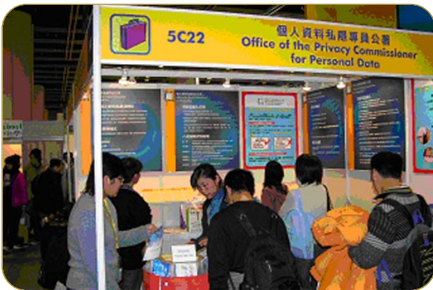
▲ 公署參加了「教育及職業博覽2005」。