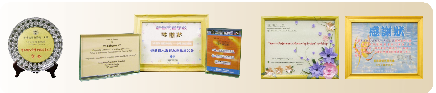
▲ 各機構贈予公署的感謝狀。