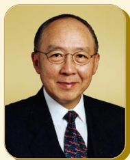
*主席 鄧爾邦先生 個人資料私隱專員